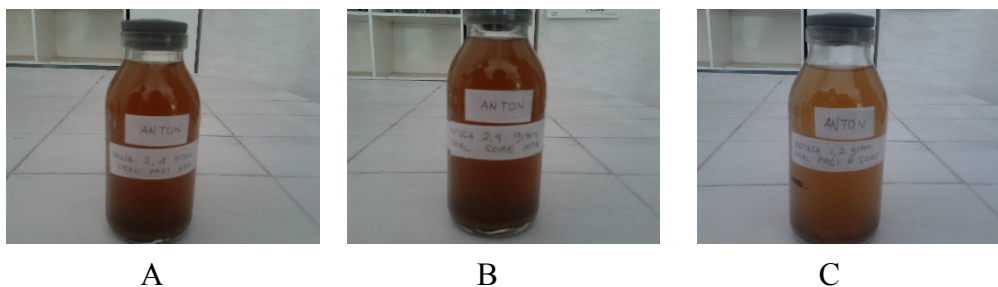
Gambar 1. Hasil Pembuatan Sediaan Infusa

Pembuatan infusa dilakukan dengan cara perebusan dilakukan untuk menyari zat-zat dalam simplisia. Hasil rebusan disaring selagi panas yang bertujuan untuk mencegah pengendapan kembali hasil sarian. Hasil pembuatan infusa dapat dilihat pada gambar 1.