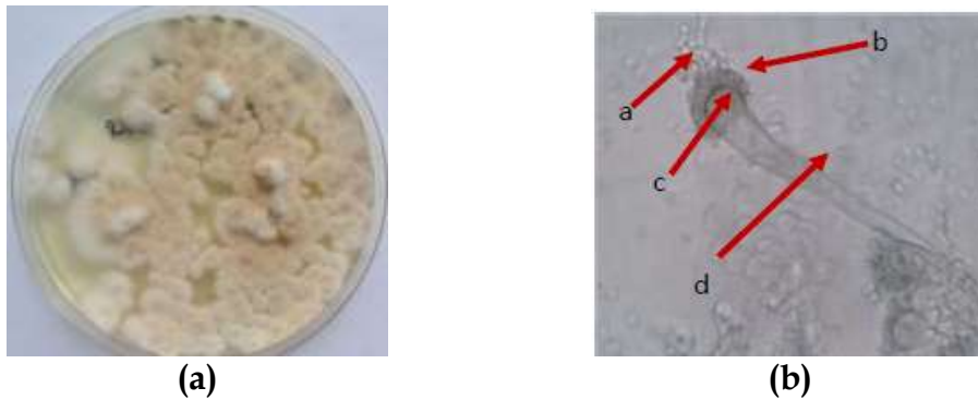
Gambar 2. (a) Aspergillus sp pada media PDA (b) Penampakan Aspergillus sp secara mikroskopis. Keterangan: a. Konidia b. Sterigma/fialid c. Vesikel d. Konidiofor

secara vegetatif dan generatif melalui pembelahan sel dengan spora yang dibentuk di dalam askus.