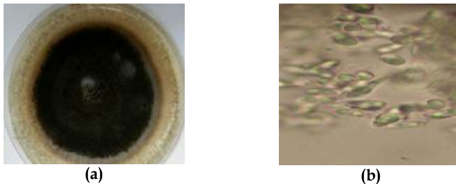
Gambar 5. (a) Makroskopis Cephalotrichum sp (b) Mikroskopis Cephalotrichum sp

Secara mikroskopis Cephalotrichum sp memiliki konidia yang berbentuk bulat dan berwarna hitam, hifa bersepta dan berwarna coklat, konidiofor berdinding tipis, vesikel berbentuk bulat dan berwarna coklat kehitaman. Cephalotrichum sp merupakan parasit lemah (menyerang tanaman yang sedang berada pada kondisi lemah) yang dikarenakan kekeringan dan kekurangan unsur hara. Jamur tanah Cephalotrichum sp dapat menginfeksi jaringan inang sebelum ada serangan jamur patogen lain dan dapat menimbulkan gejala seperti bercak pada tanaman (Juniawan, 2015).